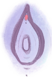
TIPO 1 - CLITORIDECTOMÍA